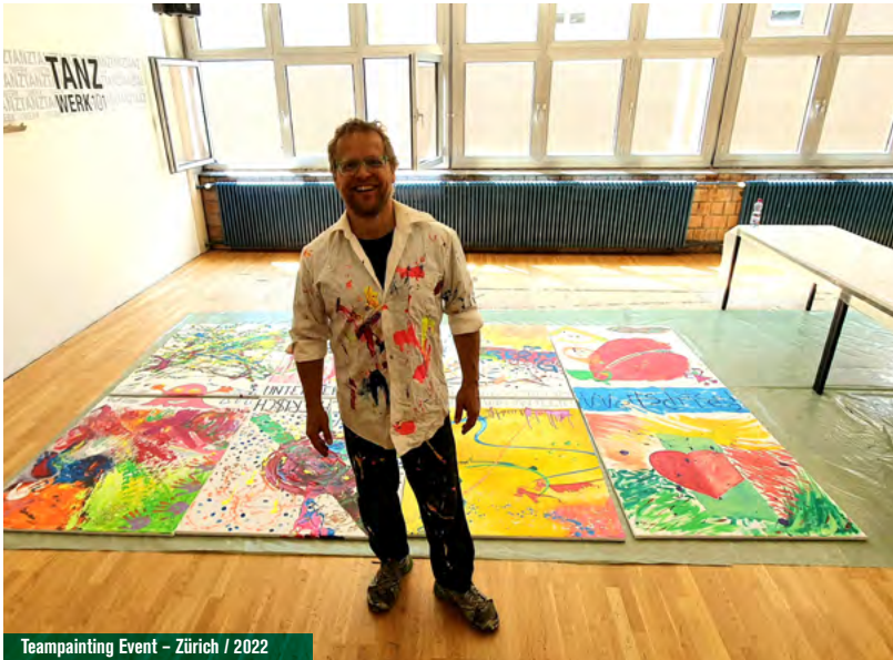
Teampainting Event – Zürich / 2022